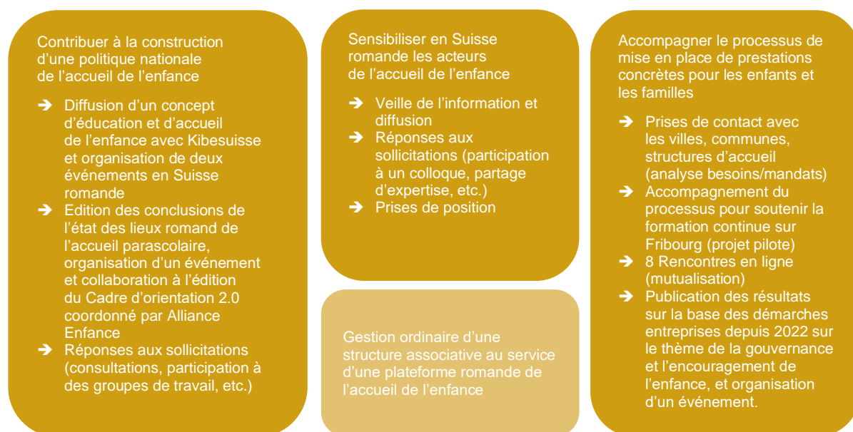
Illustration des principales mesures 2025

La diffusion des informations portant sur l'accueil de l'enfance ou encore les réponses aux sollicitations nationales et romandes seront aussi d'actualité.