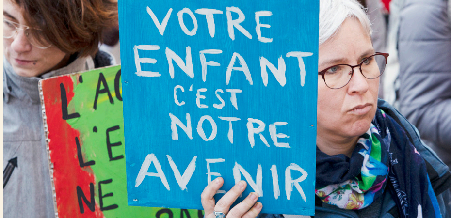
Journée d'action suisse du 16 novembre 2019

La campagne « Les enfants dessinent l'avenir » a été officiellement lancée lors d'une Journée d'action suisse le 16 novembre à Lausanne. Le programme comprenait un colloque scientifique organisé en matinée par pro enfance et un après-midi ludique dans l'espace public coordonné par l'Association et une dizaine d'acteurs vaudois. Le colloque scientifique « pour une politique publique cohérente en matière d'encouragement et d'accueil de l'enfance » a réuni près de 350 participant-e-s. Il a nourri les pratiques et la réflexion stratégique, sur la base de l'état des lieux mené par l'Association, et permis de présenter des démarches entreprises sur le plan national.