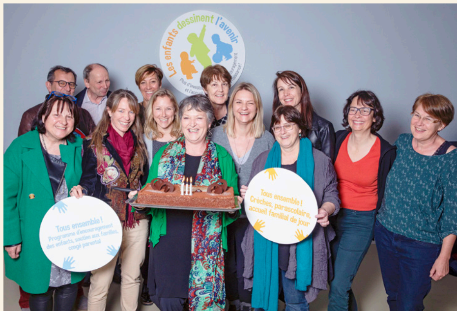
pro enfance a soufflé ses 5 bougies lors de son Assemblée générale.

En 2020, il s'agira plus particulièrement de définir la stratégie de pro enfance pour les années 2021-2025.