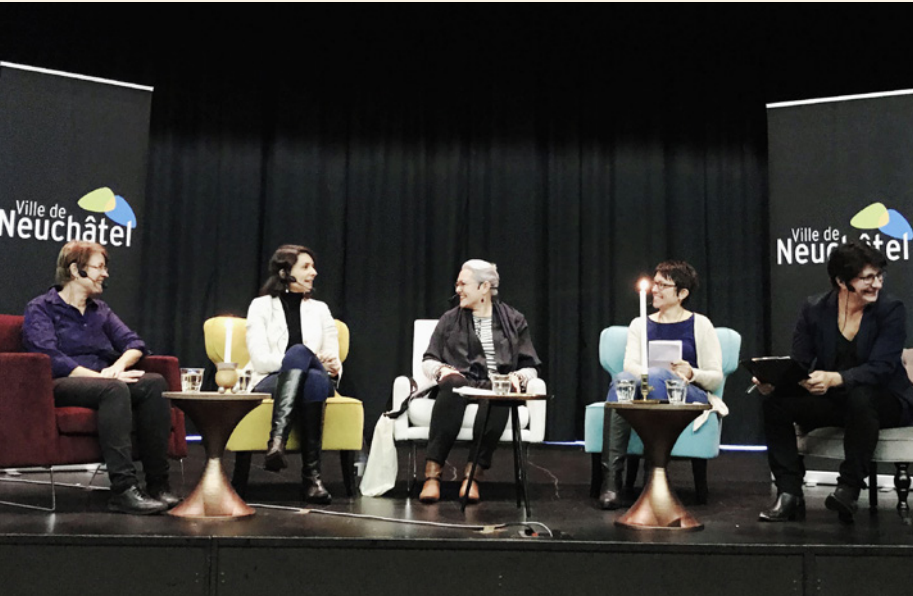
Organisation d'une table ronde pro enfance le 9 novembre, mise en scène par le Service de l'accueil de l'enfance de la Ville de Neuchâtel.

pro enfance a pour but de favoriser la coopération et la compréhension mutuelle entre les acteurs des domaines de l'accueil de l'enfance en Suisse romande, entre les différentes régions linguistiques suisses et au niveau national.