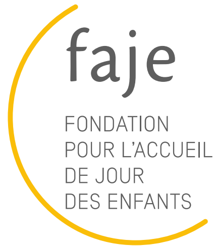
Table ronde Pro Enfance 15 novembre 2021