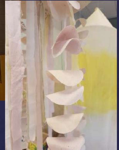
Colour snap (J. Dahlgren)