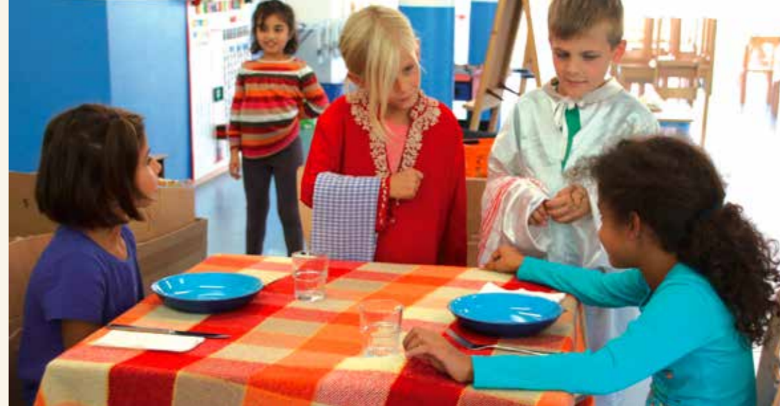
Image extraite du film « Fenêtre sur l'accueil parascolaire ». pro enfance a participé à l'avant-première qui s'est déroulée à Lausanne le 24 avril.