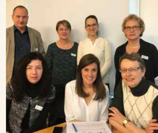
Table ronde du 30 novembre à Bienne.

En 2017, deux séances annuelles de coordination ont été organisées sur le plan national. Ces rencontres incluaient le Réseau d'accueil extrafamilial/Netzwerk Kinderbetreuung, la Commission suisse de l'Unesco et TIPI – Ticino Progetto Infanzia/Tessin Projet Enfance. pro enfance et le Réseau d'accueil extrafamilial se sont par ailleurs rencontrés à plusieurs reprises pour mettre en œuvre cet événement en 2019.