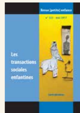
pro enfance promeut des outils comme la Revue [petite] enfance.

En 2017, la consolidation de pro enfance s'est poursuivie. Diverses démarches de recherches de fonds ont été entreprises. Les négociations avec la Fondation Jacobs se sont poursuivies et ont permis d'aboutir à un premier accord pour la période 2018-2020. Le dépliant de présentation de pro enfance a été diffusé auprès de 150 femmes entrepreneurs qui font la Suisse. Suite à la volonté du Conseil fédéral de diminuer de 20% le crédit lié aux organisations familiales, des appuis parlementaires ont été sollicités. Les démarches entreprises par les organisations concernées, dont celles de Pro Familia Suisse en particulier, ont permis de négocier une diminution de 3% de ce crédit – conformément aux restrictions imposées aux faïtières actives dans des domaines tiers.